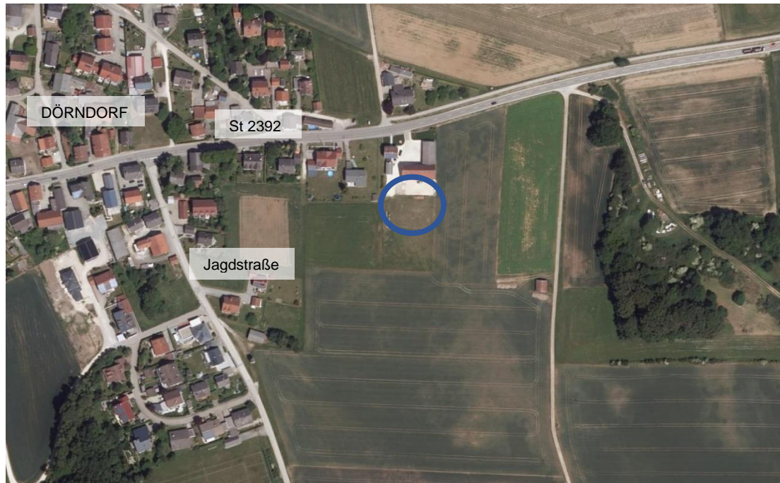
Abb. 1: Luftbild mit Kennzeichnung des Plangebiets, o.M.

entlang der Riedenburger Straße sowie der Jagdstraße. Im Süden und im Osten folgen landwirtschaftlich genutzte Flächen.