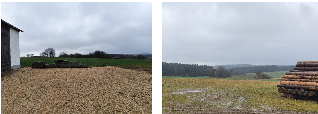
Abb. 2: Fotodokumentation – links: Blick Richtung Osten, rechts: Blick Richtung Südosten (eigene Aufnahmen, 03.03.2020)

Die Erschließung erfolgt von Norden über die Riedenburger Straße.