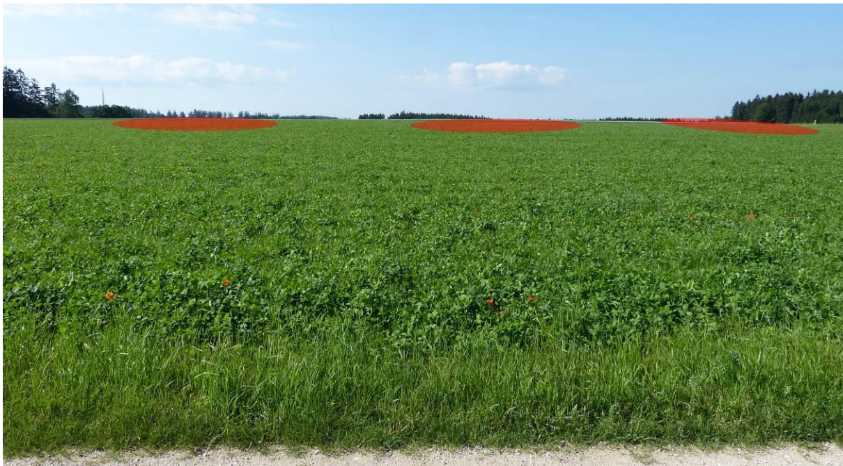
Foto 2: Blick vom Feldweg im Süden auf den südlich angrenzenden Kleeacker. Im Hintergrund ist die ungefähre Revierverteilung der Feldlerchen markiert.