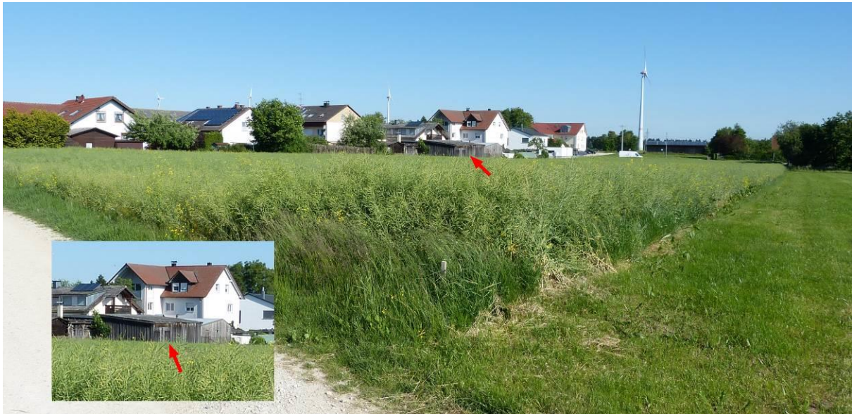
Foto 1: Blick von der Südostecke des Geltungsbereiches auf die Fläche (2020 mit Raps eingesät). Etwa in der Bildmitte befindet sich der abzureißende Schuppen (roter Hinweisfeil), im Bild links unten ein vergrößerter Ausschnitt.